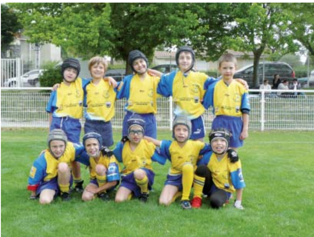
Les minis-Poussins (7 - 8 ans) portant leur nouveau maillot pour le tournoi départemental du Gard