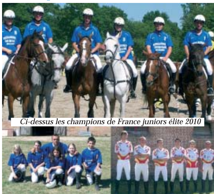
Ci-dessus les champions de France juniors élite 2010

C'est au cours du week-end de Pentecôte que se sont déroulés les championnats de France de Horse-ball à LAMOTTE-BEUVRON, près d'Orléans, au cours du GRAND TOURNOI, où se côtoient le polo, les pony-games et le horse-ball, soit 300 équipes présentes. La ville de Bellegarde y était représentée par quatre équipes du club hippique du Mas de Rom. Les JUNIORS en catégorie ELITE ont remporté le titre de champions de France 2010; les benjamins, pour leur première participation, se sont classés 7 e en N2 ; les cadets, entente BELLEGARDE/GRANS, ont terminé 4 e en ELITE CADETS PONEYS et les 5 e catégorie ont également fini à la 4 e place en catégorie EXCELLENCE ELITE. Félicitations à l'ensemble des cavaliers et à leurs coachs.