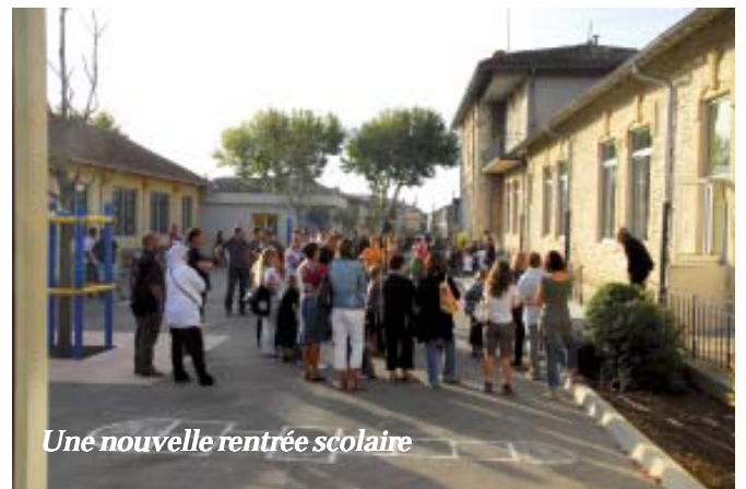
Une nouvelle rentrée scolaire