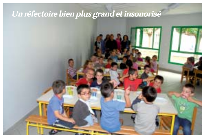
Un réfectoire bien plus grand et insonorisé