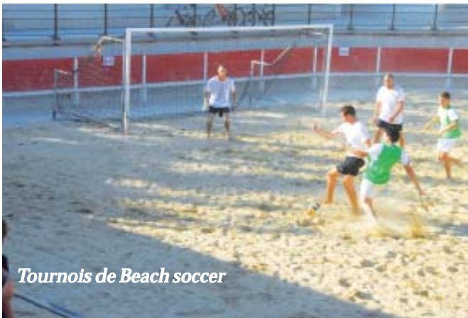
Tournois de Beach soccer

Depuis la rentrée, le nouveau réfectoire de 80 m 2 de l'école maternelle Philippe Lamour (terminé au cours de l'été), permet à nos jeunes enfants de prendre leurs repas dans un espace beaucoup plus accueillant et confortable (l'ancien réfectoire, trop petit, était mal insonorisé donc très bruyant). L'éducation reste une des priorités de notre municipalité. La réalisation du futur groupe scolaire de la ZAC des Ferrières et de la nouvelle cuisine centrale est un investissement qui structurera notre village pour les 10 à 20 ans à venir.