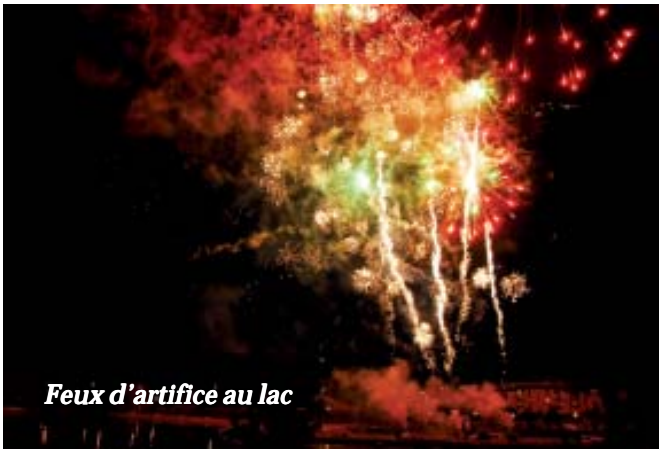
Feux d'artifice au lac