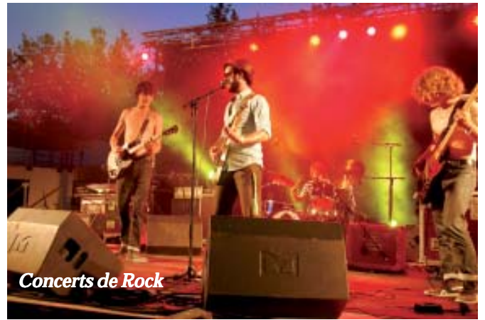
Concerts de Rock