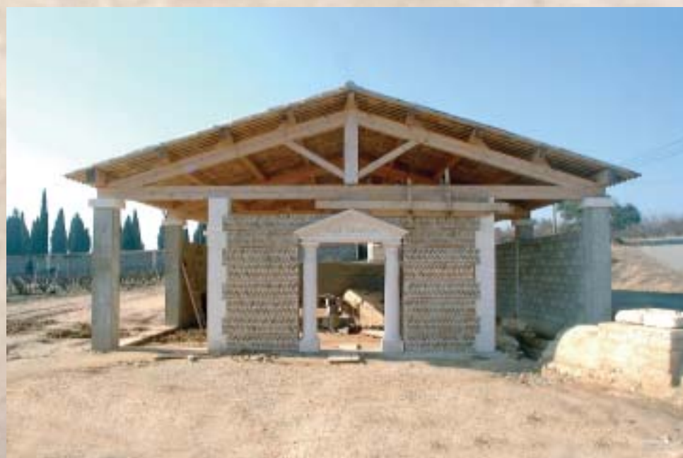
Le futur musée de l'eau

Arles en eau, pendant une période comprise entre deux cent cinquante et quatre cents ans. Cette conduite enterrée de plusieurs kilomètres, a été assez bien conservée puisque difficilement accessible. Par contre les ouvrages aériens de cet aqueduc ont totalement été détruits. La « Draille des Arcs », qui est aujourd'hui sur la limite communale qui sépare à l'ouest Bellegarde de Beaucaire est très certainement sur le tracé de l'aqueduc qui a été entièrement détruit. Il est vrai que les pierres de construction étaient rares sur Bellegarde qui ne dispose que de terrains couverts d'alluvions caillouteuses. Les galets des Costières sont identiques à ceux de la plaine de la Crau, ils ont été largement utilisés dans les constructions. Nous avons donc décidé de reconstruire, à proximité de la section enterrée de l'aqueduc, une section « aérienne », telle qu'elle existait il y a 1600 à 1900 ans, sur, ou à proximité de la Draille des Arcs. Nous avons décidé de faire couler de l'eau en circuit fermé dans le canal supérieur de l'aqueduc. Nous avons enfin, en concertation avec les spécialistes de la DRAC, Direction Régionale de l'Action Culturelle, décidé de protéger la partie exhumée de l'aqueduc, grâce à une toiture posée sur une charpente construite « à l'ancienne ». Ce bâtiment, abritera une exposition sur « la mémoire de l'eau à Bellegarde ». Sur le fronton de la porte d'entrée située sur la façade Est, du bâti-