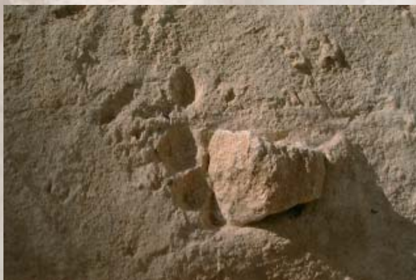
Empreinte des doigts d'un maçon romain