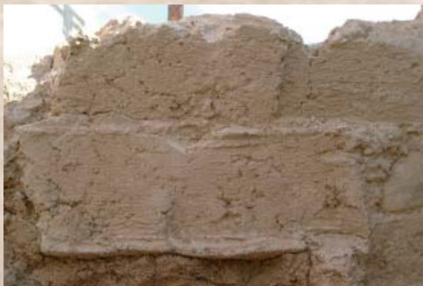
Empreinte de planches de coffrage

Certains historiens pensent que c'est Charlemagne (742-814), devenu empereur en l'an 800 qui a fait détruire l'ouvrage, comme l'aqueduc de la vallée des Baux, afin d'affamer ou d'assoiffer les Sarrasins qui avaient conquis Arles. A cette théorie une autre beaucoup plus prosaïque consiste à dire qu'après l'effondrement de l'empire romain, les « bar-